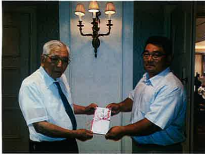
【九都県市防災訓練(銚子支部)】