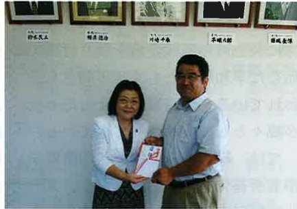
【交通遺児援護基金】