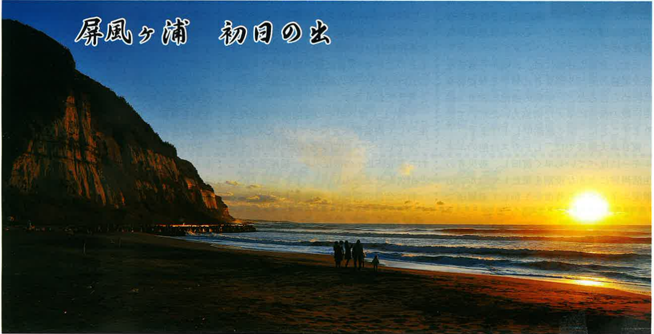
屏風ヶ浦 初日の出

発行 一般社団法人千葉県LPガス協会広報委員会 〒260-0024 千葉市中央区中央港1-13-1 TEL 043-246-1725 FAX 043-243-6781 E-mail: chibalpg@chibalpg.or.jp http://www.chibalpg@chibalpg.or.jp 毎月10日は保安の日