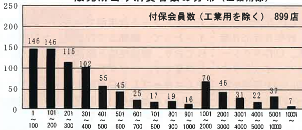
一販売所当り消費者数の分布(工業用除)