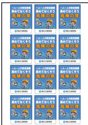
No.9 セーフティシールA