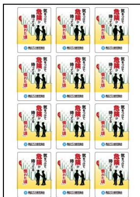
No.10 セーフティシールB