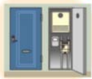
玄関脇のメーターボックス内に設置