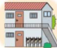
屋外に複数並べて設置